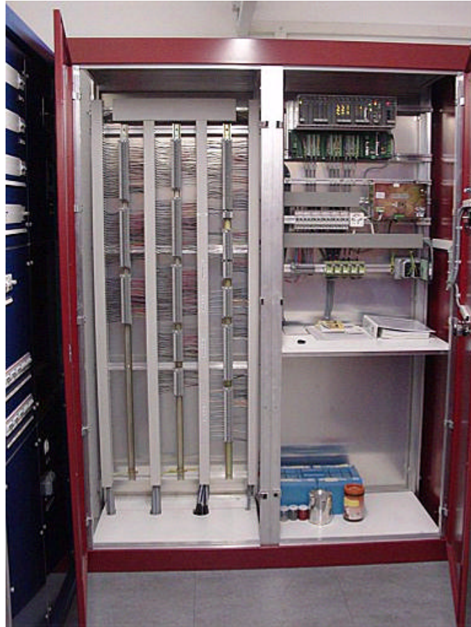
Unterverteilung Befehle und Meldungen von Mittelspannungsschalter und Trafos