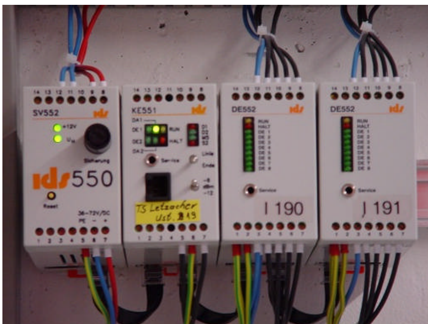
Netzleitunterstation in Modulform