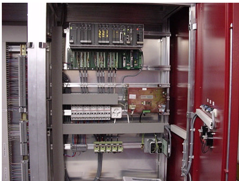
Prozessleitsystem Netzleitunterstation ABB