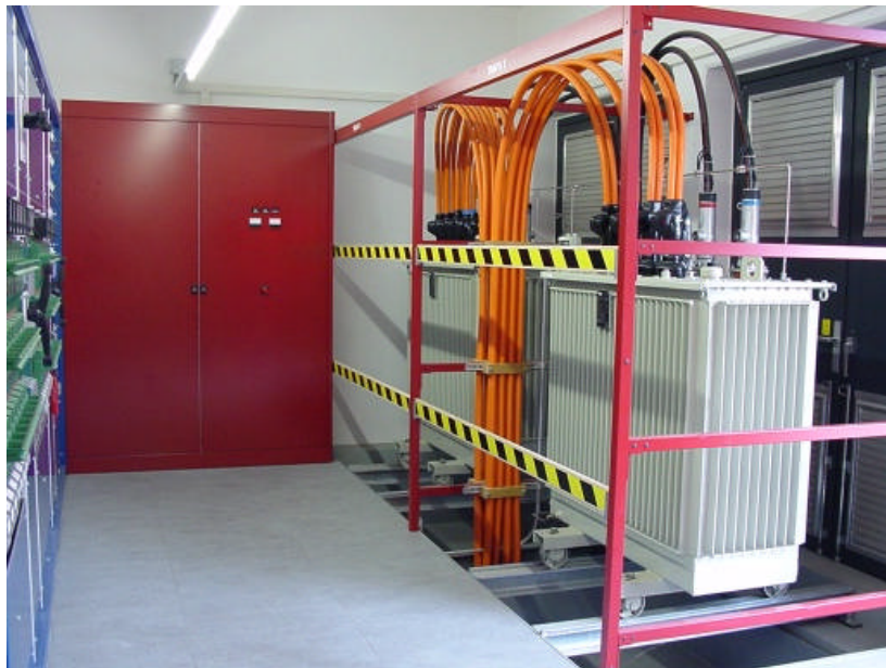
16 kV Trafo