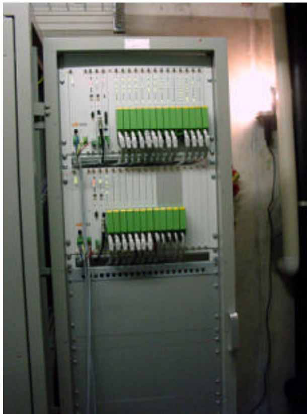
Schaltschrank nach Einbau neuer Netzleitunterstation von IDS